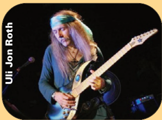
Uli Jon Roth

Ana Popovic Cette guitariste hollandaise est considérée comme une réincarnation féminine de Jimmy Hendrix. Du blues, du blues, encore du blues et du rock!